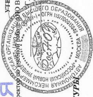
ГРАФИК ПРОВЕДЕНИЯ ОТЧЁТНО-УСТАНОВОЧНЫХ СБОРОВ СО СТУДЕНТАМИ МАГИСТРАТУРЫ ЗАОЧНОЙ ФОРМЫ ОБУЧЕНИЯ в 2024/2025 учебном году