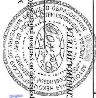
ГРАФИК ПРОВЕДЕНИЯ ОТЧЁТНО-УСТАНОВОЧНЫХ СБОРОВ СО СТУДЕНТАМИ БАКАЛАВРИАТА, СПЕЦИАЛИТЕТА, ЗАОЧНОЙ ФОРМЫ ОБУЧЕНИЯ в 2024/2025 учебном году