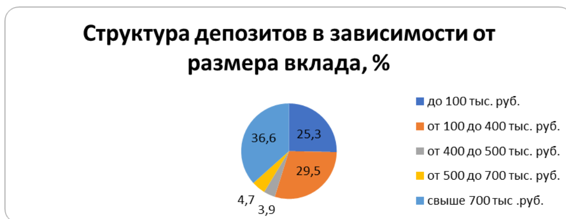
Рис. 1. Название рисунка

Рисунки следует помещать таким образом, чтобы их можно было рассматривать без поворота или с поворотом работы по часовой стрелке. Заголовок помещается под рисунком в одну строку со словом «Рис.» и его номером.